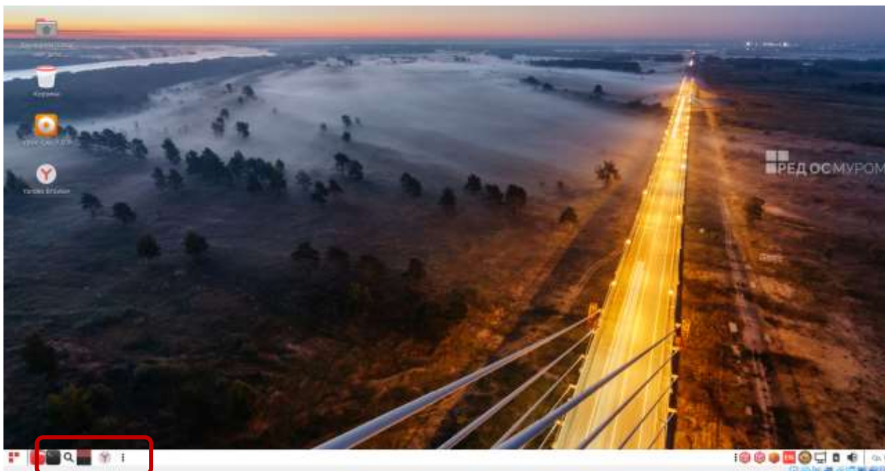
Рисунок 2 Desktop виртуальной машины

Необходимо нажать на иконку браузера «Яндекс Браузер» (в данной операционной системе установлен по умолчанию), после чего запустится данный браузер. (См. Рисунок 2).